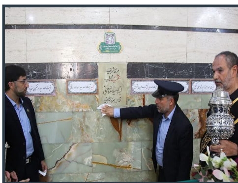
مزار شهید محراب «بیت الله مدنی» عبا روبروی شد