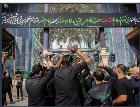
عرض تسلیت مردم قم به محضر کریمه اهل بیت(س) به مناسبت شهادت کریم اهل بیت(ع)

اولین اجرای تواشیح و جمع خوانی قرآن کریم توسط گروه قاریان نوجوان حرم مطهر بانوی کرامت در مسجد امام رضا علیه السلام شاهرود انجام شد.