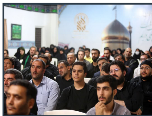
مراسم تقدیر از خدام موبک حرم حضرت معصومه(س) برگزار شد