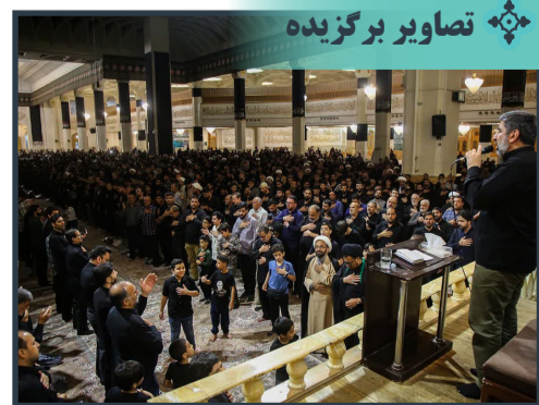
برگزاری مراسم سوگواری به مناسبت ۲۸ صفر در حرم حضرت معصومه(س)