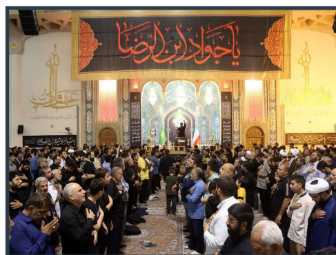
زائران حرم قم در سوگ شهادت امام جواد(ع)