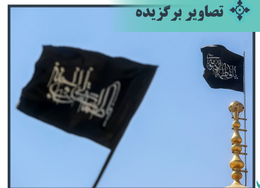
اهتزاز پرچم عزای شهادت امام جواد(ع) بر فراز گنبد حرم بانوی کرامت