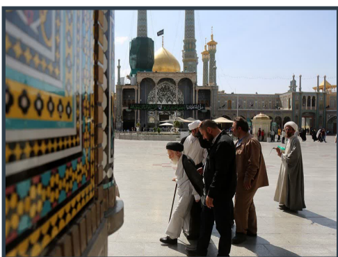
تشریف آیت‌الله شبیری زنجانی به زیارت حرم حضرت معصومه (س)

وی با بیان اینکه کارهای خود را حتماً باید با تدبیر و برنامه انجام دهید، افزود: برخی از کارها زود بازده نیست و به تدریج نتیجه می‌دهد بنابراین نباید برای خوش آیند برخی و زود به نتیجه رسیدن عنصر تدریج را فراموش کرد. تولیت حرم مطهر بانوی کرامت با تأکید بر اینکه قم جایگاه ویژه‌ای دارد و خدمت در این شهر خدمت به اهل بیت (ع) است، گفت: حضور در بین مردم و همراهی با مردم تأثیر زیادی در موفقیت شما دارد.