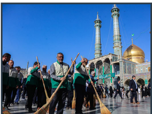
برگزاری آیین جاروکنی حرم مطهر با حضور خدام هیأت های مذهبی

گفتنی است شروع این پوشش از روز پنجشنبه ۲۸ اردیبهشت و آخرین مهلت ارسال آثار جمعه ۵ خردادماه است و اسامی برگزیدگان نیز در روز ۱۰ خردادماه مصادف با میلاد امام رضا علیه السلام اعلام خواهد شد.