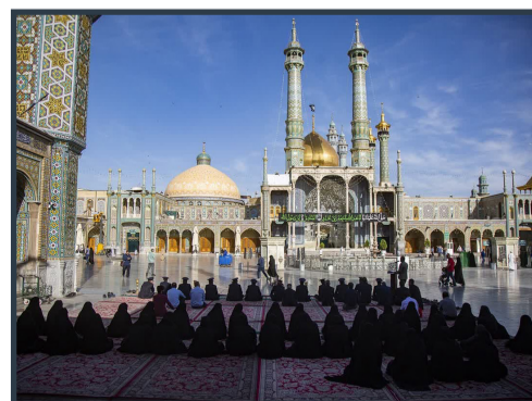
آیین خطبه خوانی خادمان حرم در آستانه دهه کرامت