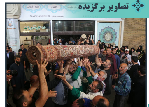
اهدای فرش های دستباف حرم رضوی به حرم قم