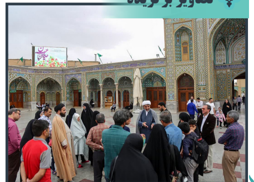
میزبانی از ۶۵ گروه و ویژه برنامه حرم شناسی حرم بانوی کرامت