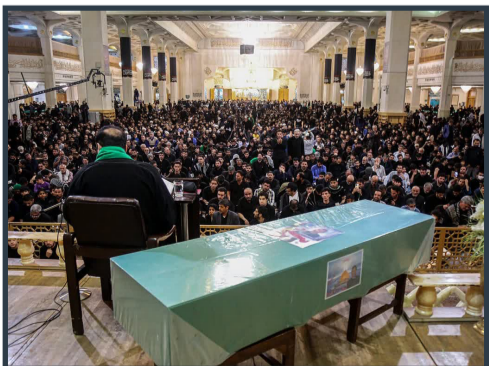
وداع با پیکر شهید مدافع حرم در شب بیست و یکم رمضان